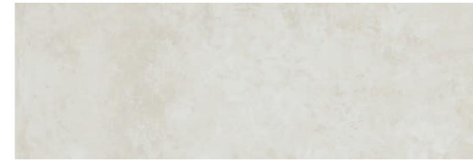
SOGBI SOGNO BIANCO 30x90 cm 12"x36" Rettificato / Rectified 112 MQ