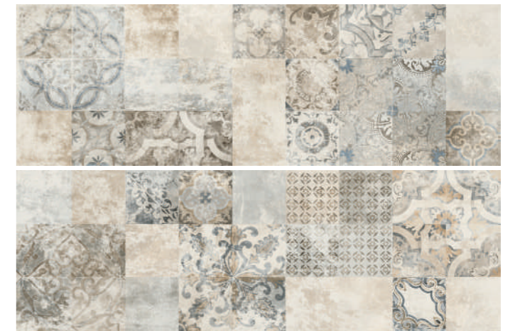
SOGDEBE SOGNO DECORO BEIGE 30x90 cm 12"x36" Rettificato / Rectified (2 pezzi/pieces) 112 MQ • MIX

* MIX I decori sono soggetti misti e sono inscatolati in modo casuale . Decorations are mixed subjects and are randomly packed.