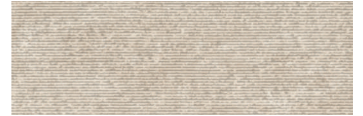
SOGSTBE SOGNO STRUTTURA BEIGE 30x90 cm 12"x36" Rettificato / Rectified 112 MQ