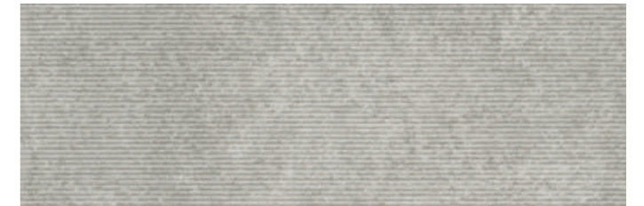
SOGSTGR SOGNO STRUTTURA GRIGIO 30x90 cm 12"x36" Rettificato / Rectified 112 MQ