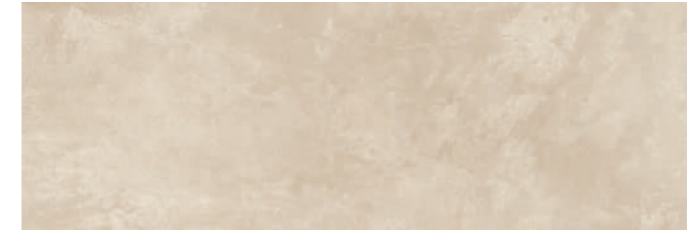
SOGBE SOGNO BEIGE 30x90 cm 12"x36" Rettificato / Rectified 112 MQ