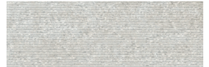
SOGSTBI SOGNO STRUTTURA BIANCO 30x90 cm 12"x36" Rettificato / Rectified 112 MQ