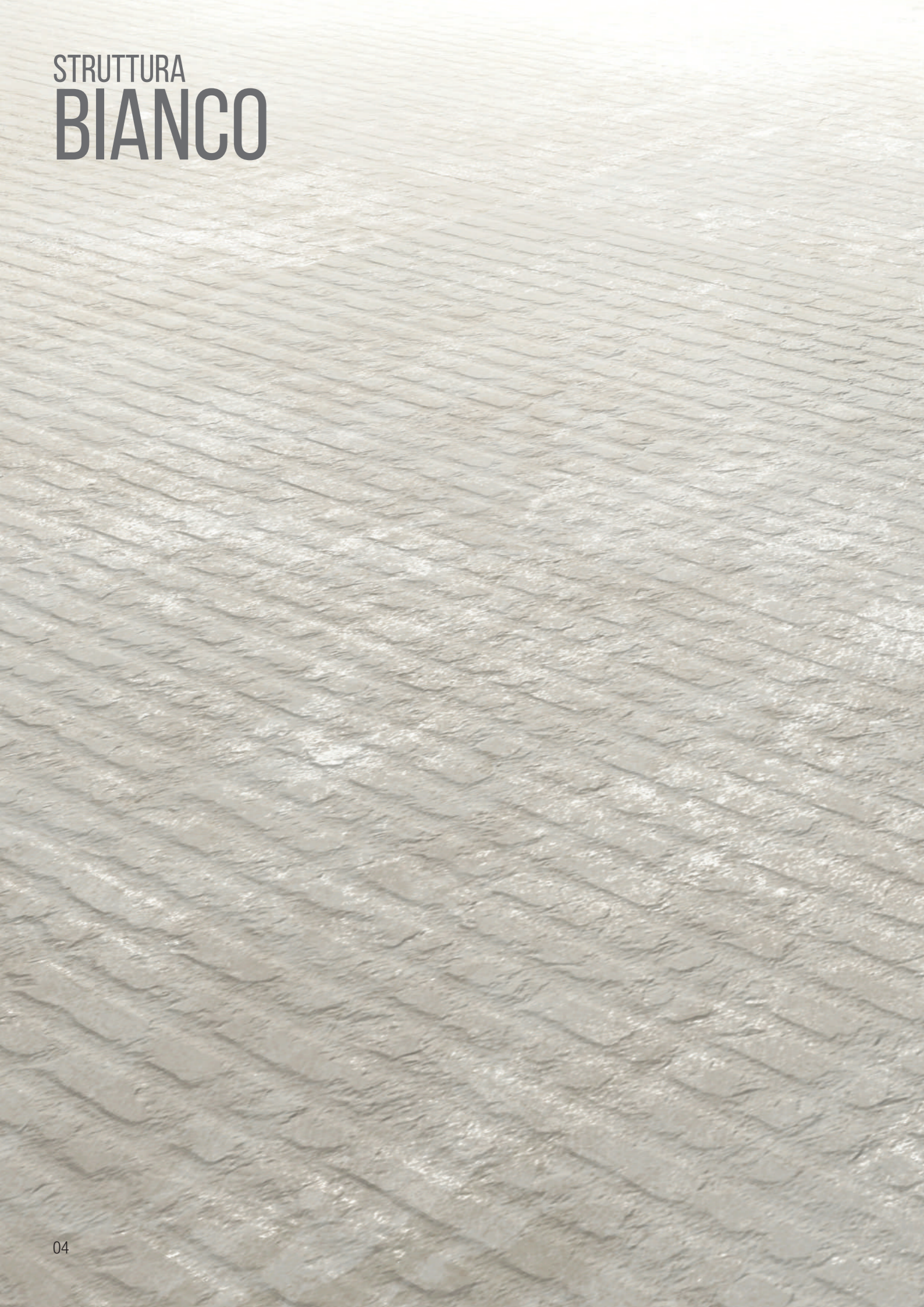
SOGNO STRUTTURA BIANCO 30x90 cm 12"x36" | DECORO BEIGE 30x90 cm 12"x36"