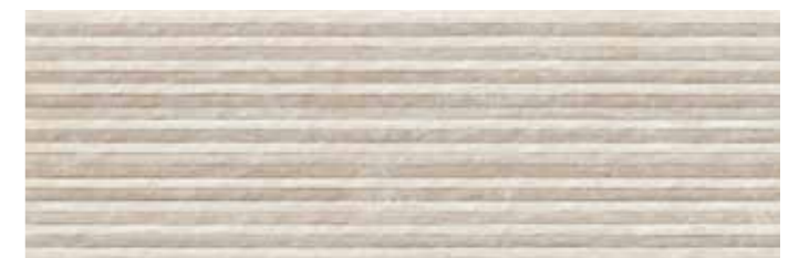
STASTBE START STRUTTURA BEIGE 30x90 cm 12"x36" Rettificato / Rectified 112 MQ