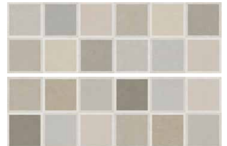
STADEBE START DECORO BEIGE 30x90 cm 12"x36" Rettificato / Rectified (2 soggetti) 112 MQ * MIX

* MIX I decori sono soggetti misti e sono inscatolati in modo casuale . Decorations are mixed subjects and are randomly packed.