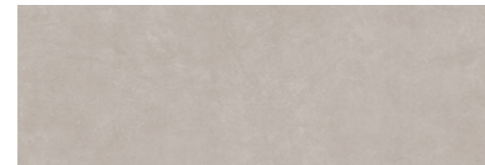
STAGR START GRIGIO 30x90 cm 12"x36" Rettificato / Rectified 112 MQ