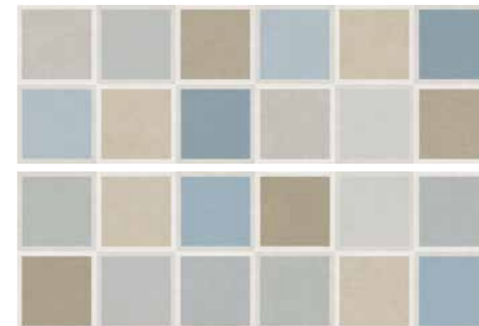
STADEGR START DECORO GRIGIO 30x90 cm 12"x36" Rettificato / Rectified (2 soggetti) 112 MQ * MIX