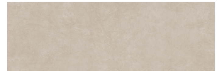
STATO START TORTORA 30x90 cm 12"x36" Rettificato / Rectified 112 MQ