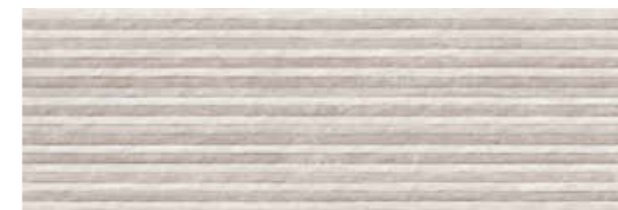
STASTGR START STRUTTURA GRIGIO 30x90 cm 12"x36" Rettificato / Rectified 112 MQ